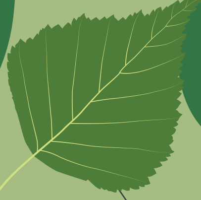
Feuille de Bouleau

La nature se mêle subtilement à l'urbanisation et se décline en une grande variété de paysages.