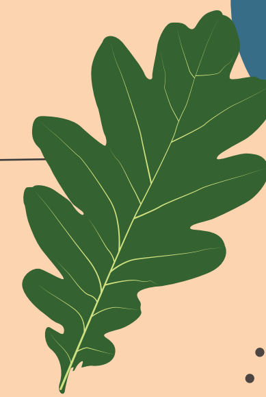
Feuille de Chêne

Cette boucle de 161 km fait le tour de Nantes Métropole, en passant par les vallons boisés du nord de la Loire et les terres du sud, consacrées aux cultures maraîchères et à la vigne.