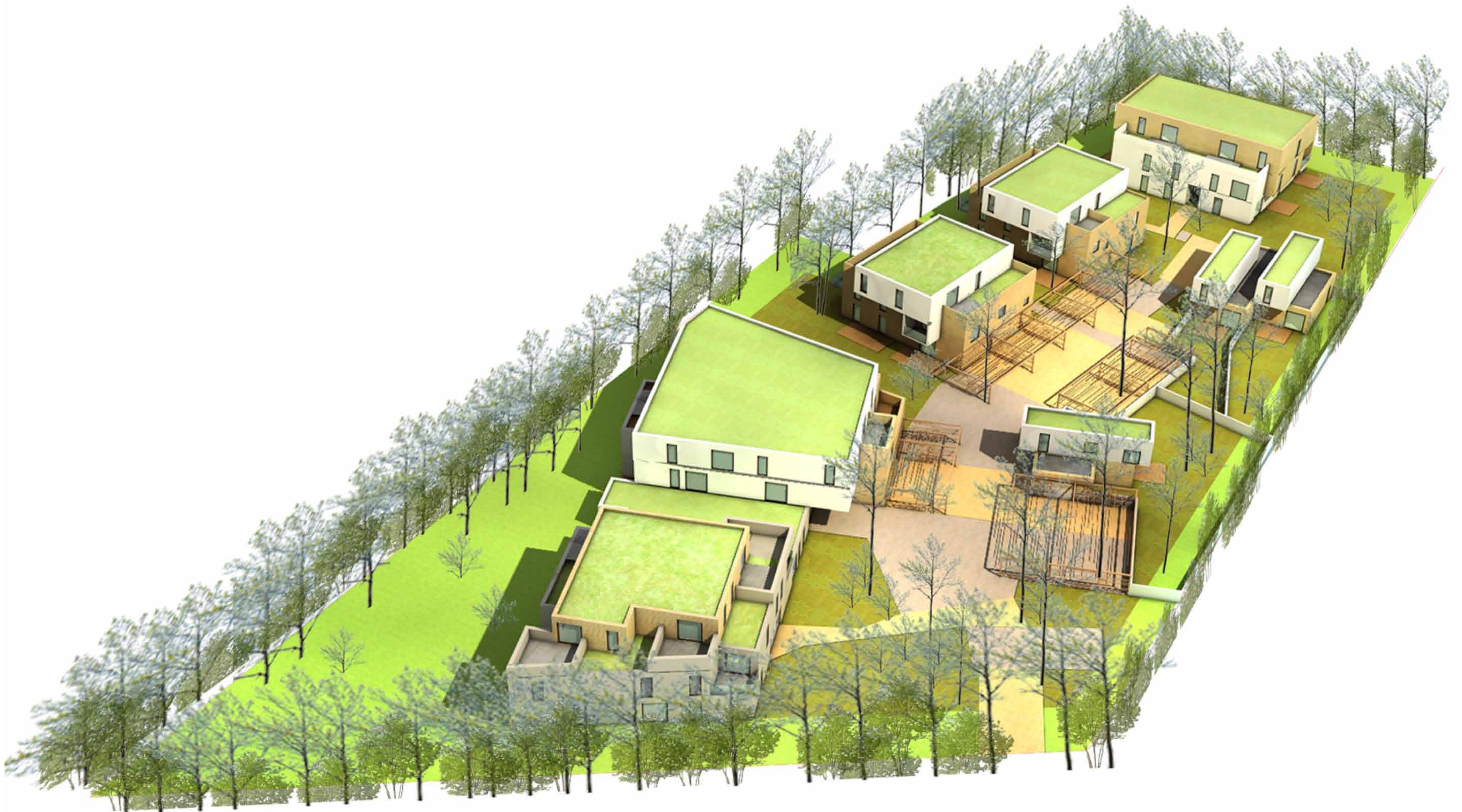
Opération Vilogia - rue Mendès France (2011)

La Ville a créé les rencontres riveraines pour permettre aux citoyens de s'exprimer sur un projet d'aménagement développé par des promoteurs immobiliers. Ces rencontres sont également organisées à la demande de riverains ou d'associations au sujet d'une problématique de quartier.