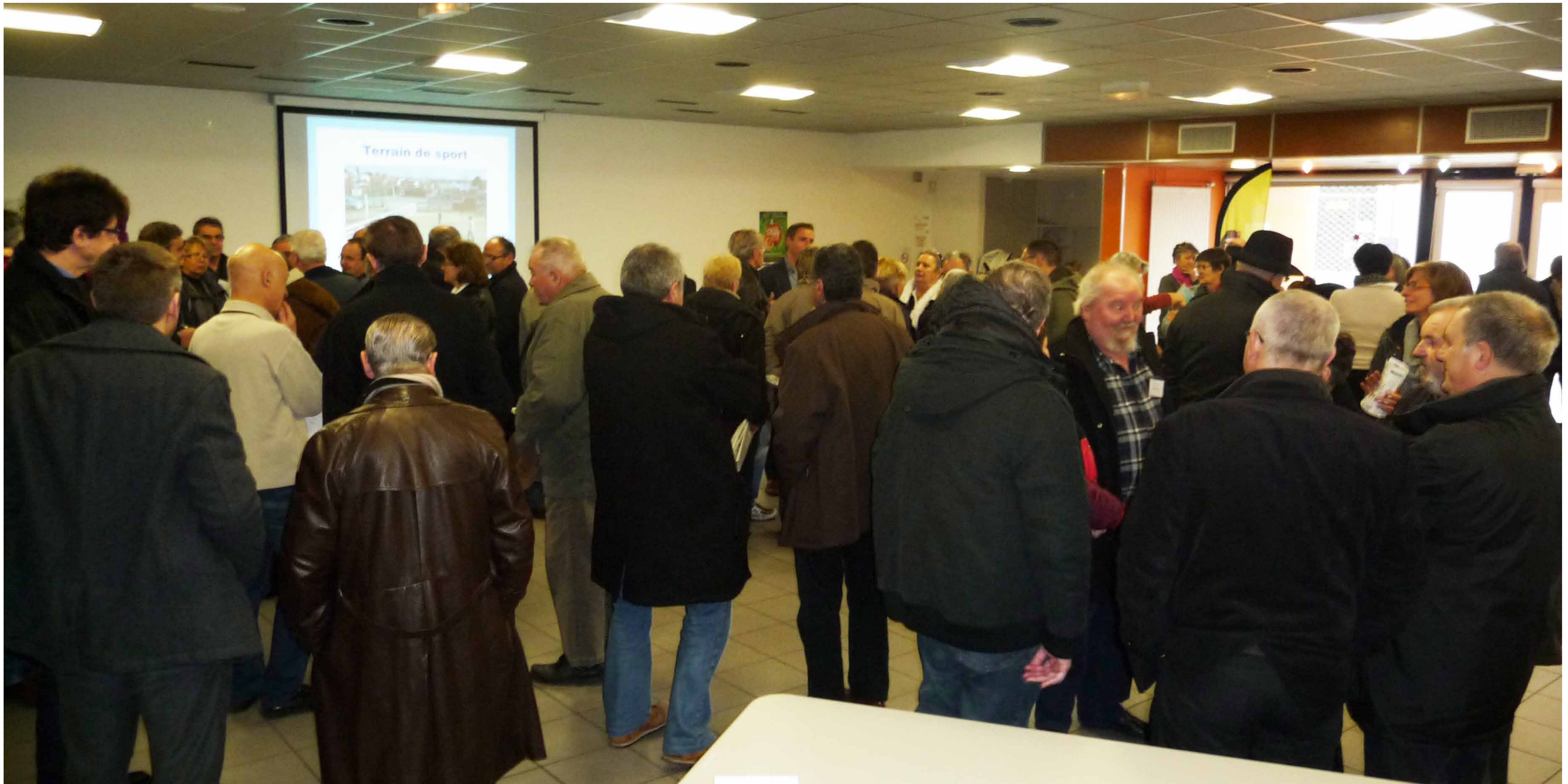
Rencontre Citoyenne de Quartier Sud - avril 2013

Les Rencontres Citoyennes de Quartier s'implantent au cœur du quartier pour que tous les citoyens puissent échanger avec les élus de manière informelle.